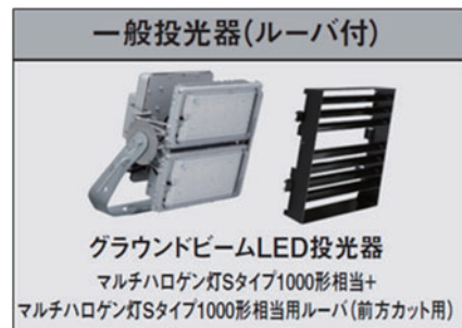
図3 当社の従来方式商品の例